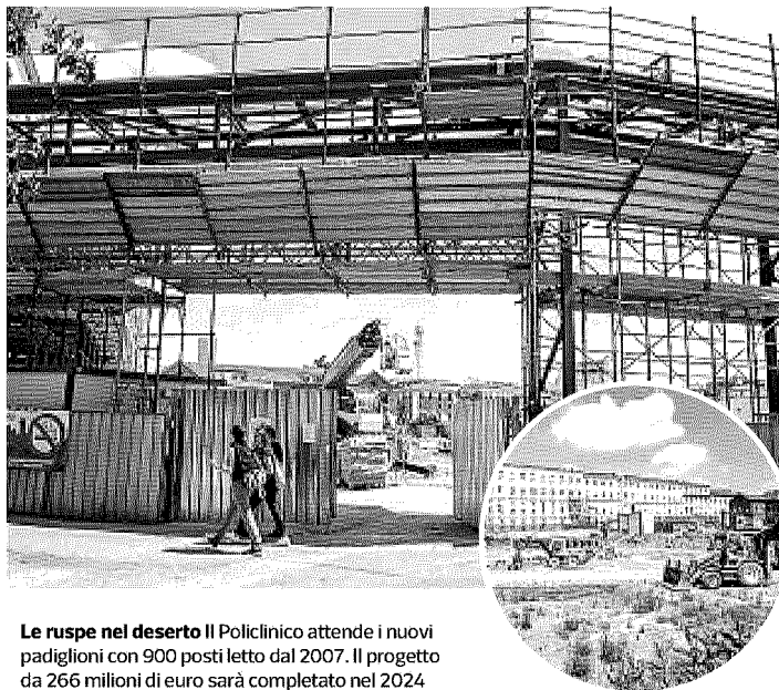
Le ruspe nel deserto Il Policlinico attende i nuovi padiglioni con 900 posti letto dal 2007. Il progetto da 266 milioni di euro sarà completato nel 2024

Gilardoni conosce bene tutti i meccanismi che possono portare ai ritardi nella chiusura dei cantieri: rallen-