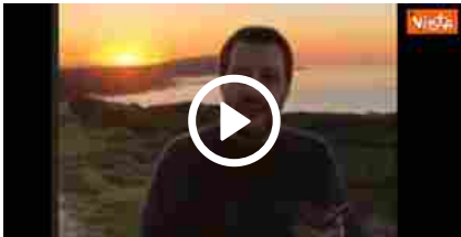
"Tramonto sardo, De André e sigarette". La dedica di Salvini ai suoi follower