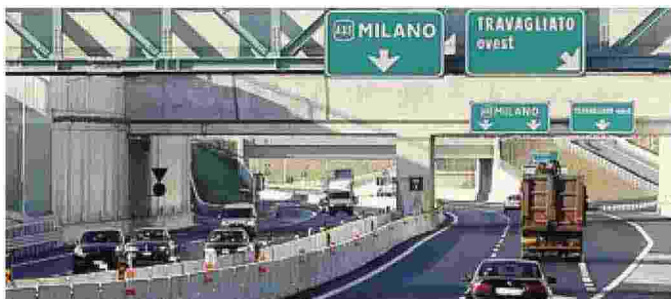
L'autostrada A35 (Brebemi) che collega Brescia con Milano

Diciotto insediamenti logistico-produttivi, 3.620 nuovi dipendenti, 22,6 milioni di euro di oneri di urbanizzazione incassati dai Comuni. Sono alcune delle «Ricadute economiche, occupazionali e ambientali di A35 sul territorio», raccolte in uno studio presentato ieri in Regione. L'obiettivo era valutare l'impatto anche «indiretto» della Brebemi sul territorio. Tra i 15 Comuni presi in esame dalla