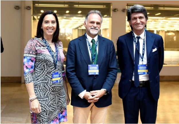
Da sinistra, la figlia Chiara Gilardoni , attuale Amministratore di Agici Finanza d'Impresa, Massimo Garavaglia , Ministro del Turismo, e Gianmario Verona , Rettore dell'Università Bocconi

Infrastrutture” e centri di ricerca economica, di cui era Presidente. Tra gli altri, gli Osservatorio Agici dedicati alle utilities, alle infrastrutture e alle rinnovabili, alcuni dei temi che gli erano più cari.